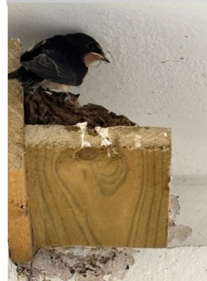
En svale har bygget rede ved Møllevangen.