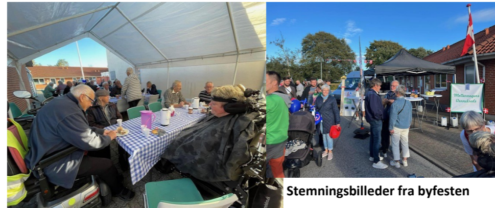
Stemmingsbilleder fra byfesten